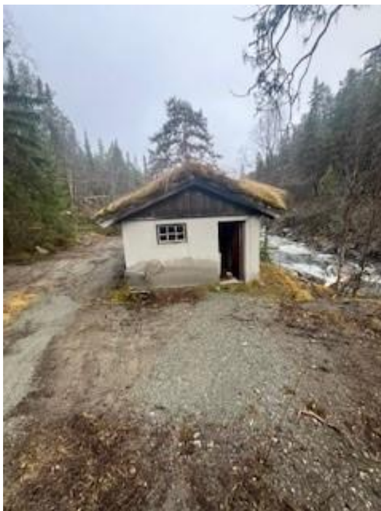
Klekkeriet ved Hinøgla

Ved Finnbølstjønn har fjellstyret en ulåst båt for fri bruk.