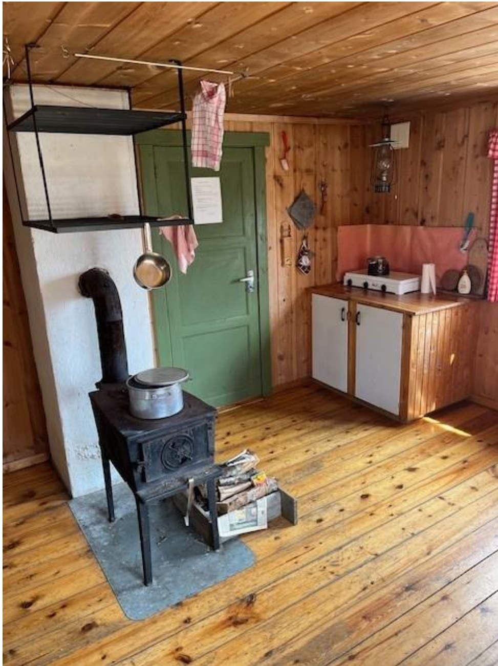
Øvre Notstulbua ved Øvre Børkdalsvatnet

Ved starten på Jotunheimvegen er Krokåtbekkbua . Denne ligger langs vegen inn mot skytebana. Krokåtbekkbua har 6 senger og leies ut via Inatur.no. Det ble kjørt inn propan og ved, og det ble gjennomført branntilsyn. Krokåtbekkbua er mye brukt om høsten av elgjaktlag. Hytta var utleid 43 døgn i 2025.